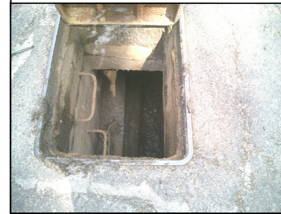
Foto tombino - torrente Borra

In prossimità dell'incrocio su via Lamarmora, il torrente sembra continuare verso i terreni ad est, come anche da testimonianza di un privato che ci conferma l'ipotesi.